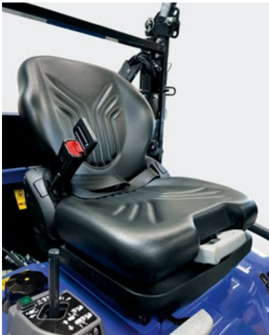
Wygodny fotel z amortyzacją.